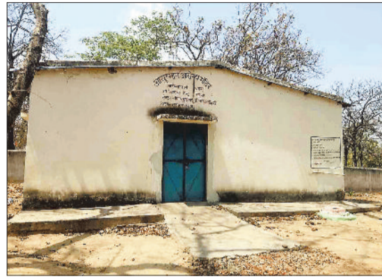
बंद उप स्वास्थ्य केन्द्र।