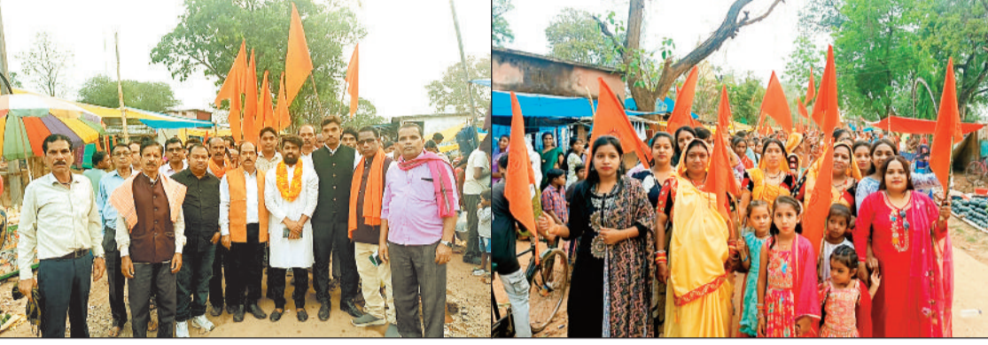
हरिभूमि न्यूज | कोतबा