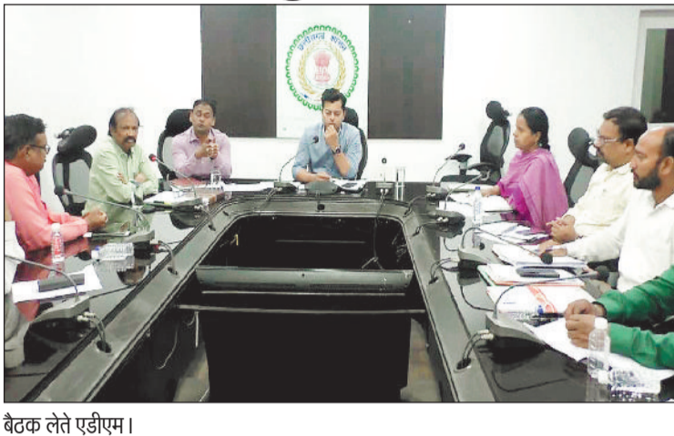
बैठक लेते एडीएम।

खाद्य विभाग की विस्तृत समीक्षा बैठक ली गई। जिले में संचालित खाद्यान्न भंडारण एवं वितरण कार्यों की प्रगति की समीक्षा की। अपर कलेक्टर ने कहा कि जिले की सभी 665 उचित मूल्य दुकानों में आगामी तीन माह का खाद्यान्न एकमुश्त भंडारित कर उसका सुचारु वितरण सुनिश्चित किया जाए, ताकि हितग्राहियों को किसी प्रकार की असुविधा न हो। उन्होंने कहा कि अप्रैल माह के भंडारण कार्य को शीघ्र पूर्ण करते हुए सभी उचित मूल्य दुकानों में चावल उत्सव आयोजित किया जाए और हितग्राहियों को समय पर खाद्यान्न उपलब्ध कराया जाए। साथ ही शेष दो माह के भंडारण कार्य को 15 अप्रैल तक पूरा करने के निर्देश दिए। अपर कलेक्टर ने सभी गोदामों में भंडारण एवं